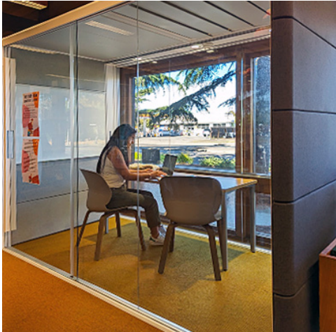
Cubículo de estudio de la Biblioteca de Petaluma