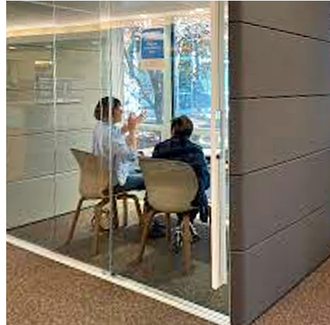
Cubículo de estudio de la Biblioteca de Rohnert Park-Cotati