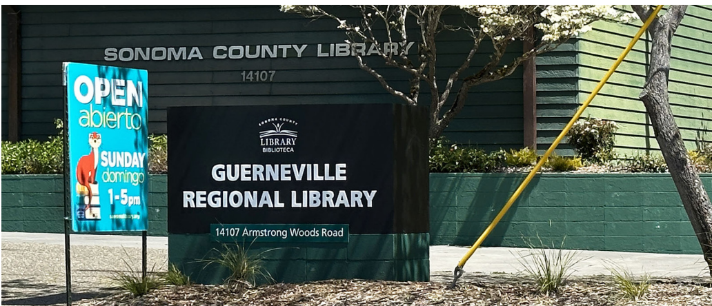
Rótulo de la Biblioteca Regional de Guerneville