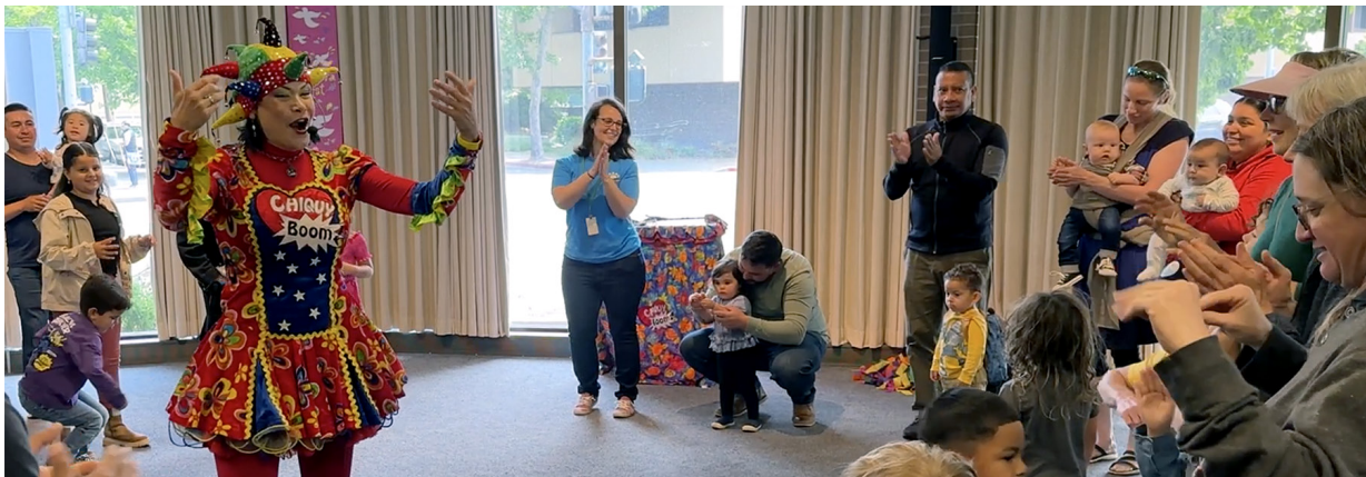
Lectura Fest en la Biblioteca Central de Santa Rosa